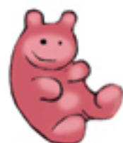
Osito de gominola